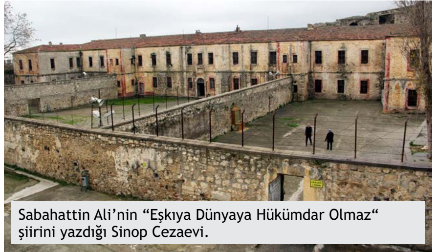
Sabahattin Ali'nin “Eşkiya Dünyaya Hükümdar Olmaz” şiirini yazdığı Sinop Cezaevi.

Civar köyün ağaları birleşmişler de düşmüşler Şükrü'nün peşine, yerini jandarmaya söylemişler. Türküden de biliriz 500 atlı düşmüş Sandıkçıoğlu'nun peşine, bir yanını jandarma sarmış diğer yanını ise bir zamanlar iyilik yaptığı Varilcioğlu ve adamları... Teslim olan Şükrü'yü kalleşçe arkadan kurşunlamış Varilcioğlu... Şükrü, mertçe ölmüş ama adını yaşatmış yöre halkı, yiğitliğini ve iyiliklerini kuşaktan kuşağa anlatmış. Aradan yıllar geçmiş, egemenler bu sefer Sabahattin Ali'yi atmışlar Sinop zindanlarına, şiir okuduğu ve zulmün karşısında haklının yanında durduğu için... İşte Sabahattin Ali de yattığı zindanları daha önce mesken tutan Sandıkçıoğlu'nun hikâyesini burada dinlemiş, Eşkiya Dünyaya Hükümdar Olmaz şiirini burada yazmış.