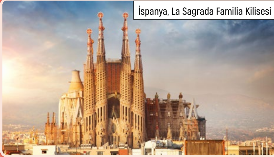
İspanya, La Sagrada Familia Kilisesi

Binlerce yıl öteleden günümüze uzanan yapılar, aslında bizlere emeğin serüvenini anlatır. Tüm zenginlik doğanın emeğin ürünüdür. Emektir doğadaki zenginliği işleyip dönüştüren. Ta Firavunların Mısır'ından Roma'ya, Hindistan'dan Korkunç İvan'ın Moskova'sına kadar... Dillere destan olmuş şehirleri kuran emektir. Piramitler, saraylar, kanallar, katedraller, sarnıçlar, kemerler, tapınaklar... Emektir bugünün insanını dahi hayrete düşüren tüm bu yapıları yaratan yegâne güç!