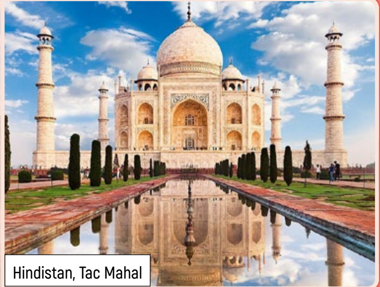
Hindistan, Tac Mahal

Tüm ihtişamıyla Tac Mahal duruyor gözlerimizin önünde... Yılda 3,5 milyon kişi tarafından ziyaret edilen ve sadece Hindistan'ın değil, dünyanın da en görkemli yapılarından biri... Güç ve kudret kadar şükran ve sevginin de sembolü olarak kabul görür. Bundan beş asır önce, o zamanki adıyla Babür İmparatorluğu'nun bir hükümdarı olan Şah Cihan'ın, on dördüncü çocuğunu doğururken hayatını kaybeden eşi için yaptırdığı bir anıttır Tac Mahal. 20 yılda, 20 bin işçinin ölesiye emek harcayıp ter dökmesiyle inşa edilmiştir ama bu ancak bir ayrıntıdır tarih kitaplarında! 20 yılda, 20 bin işçi... Bir cümleye sığdırılan bu küçük ayrıntıya kim bilir nice acılar sığmıştır? Hükümdarın şükran ve sevgi gösterisi; kaç ailenin ocağını söndürmüştür kim bilir? Şimdi soralım: Tac Mahal aslında bu 20 bin işçiyi temsil eden bir anıt değil mi? Bizim için öyledir!