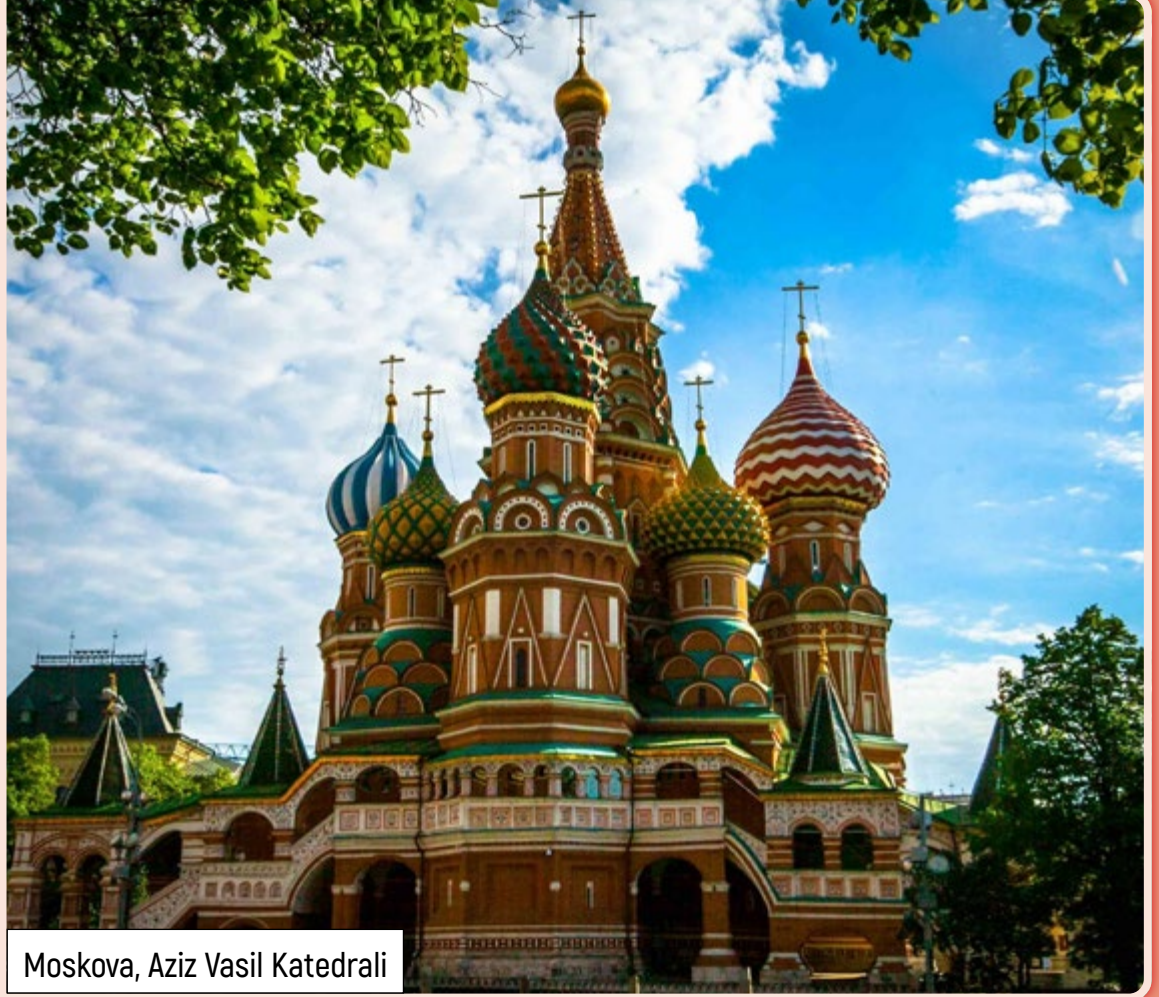
Moskova, Aziz Vasil Katedrali