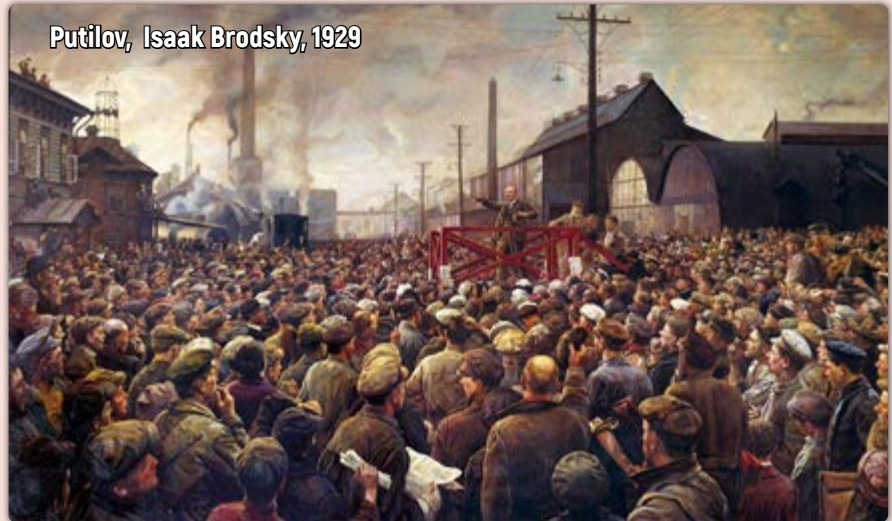
Putilov, Isaak Brodsky, 1929

Şimdi dönelim ilk tablomuza... Gemi çeken Burlaklardan en genç olanı, dikkat edin diğerlerinden farklıdır. Başını yere eğmemiştir, gözünü ufka dikmiştir. Onu esir alan kayışlarından kurtulmak istemektedir sanki! Yarım asır öncesinden 1917 Ekim'inin habercisidir ilk tablomuz, bugünün insanına da çok şey anlatır; koşullar ne denli zahmetli olursa olsun, umut her daim olmalıdır. Zulme ve sömürüye boyun eğmeyen insanlık, bir gün sonsuza kadar kurtulacak esaret prangalarından biliyoruz. Yeter ki inansın ve yekvücut olsun!