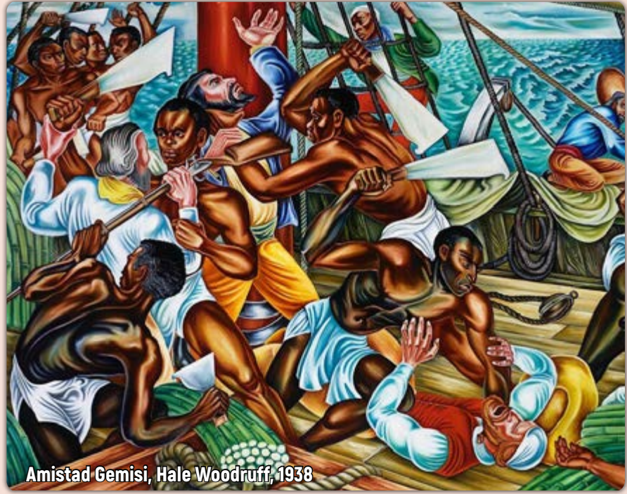
Amistad Gemisi, Hale Woodruff, 1938

Hırçın dalgalar gibi geminin güvertesi de kızılca kıyamet! Boğaz boğaza bir dövüş var karşımızda, kara derililer palayla saldırıyor insanlara. Bu bir vahşet, barbarlık! İlk bakışta manzara bu ama kim ola ki bu kara derililer? Neden bu kadar öfkeliler? 1800'lerin yüzlerce köle gemisinden yalnızca biridir Amistad. Kelime anlamı dostluktur, ilginç! Sierra Leone'den silah zoruyla kaçırılan insanlar bu gemilere doldurulup Amerika'ya götürülüyor, köle olarak satılıyordu. Dönemin efendileri bir kap yemek karşılığında onlara her türlü işi yaptırıyordu. Bir efendi, kölesine isterse tecavüz edebilir ve onu öldürebilirdi. Amistad'a doldurulan kara derililer, 1839 yılında köle tüccarlarının palalarını ellerine geçirip isyan ettiler. Bu dünya anlatılması güç nice acılara tanıklık etti. Hem de modern bir çağda köleleştirilen siyahların gördüğü zulmü ve kahrını anlatması güçtür. Bu tablo, siyahların çektiği acı ve isyana dairdir. İsyan etmekte haklı değiller miydi? Asıl barbar olan kimdi?