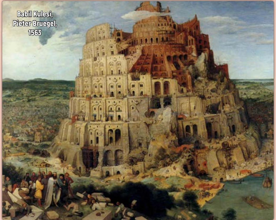
Babil Kulesi, Pieter Bruegel, 1563

Efsaneye göre gaddarlığıyla anılan Kral Nemrud, tanrılar katına yükselmek ve kendisini ölümsüz kılmak için göklere erişen bir kule inşa ettirmeye karar verir. Resmin merkezinde kibir kulesi Babil'i, sol alt köşede ise kuleye tek taş bile koymayan kibir abidesi Nemrud'u görüyoruz. Yanında silah kuşanmış askerler var, önünde ise diz çöküyor taş kıran, taş taşıyan işçiler. Görüyor ve anlıyoruz ki bugünün egemenlerine atalarından miras; kibirleri, güç ihtirasları, barbarlıkları ve hatta kimisinin Nemrud suratu... Babil kulesi kibrin ve Nemrud ise kötülüğün simgesidir. Gelecek kuşaklar da kapitalist düzeni ve bu düzenin egemenlerini böyle anacaklar.