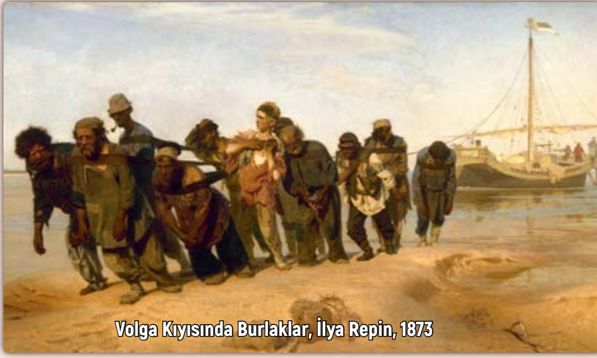
Volga Kıyısında Burlaklar, İly Repin, 1873

Tarih boyunca sömürücü zalimlere karşı mücadele etti emekçiler, hiçbir zaman topyekûn boyun eğmedi insanlık. Sömürülen ve horlananlar, zorlu dönemlerden geçip bedeller ödeyerek bugüne geldi. Kimi zaman acze düştüler, çile çektiler ama kimi zaman da tarihin yelelerini ellerine aldılar. Sanatın çeşitli alanları bunun yakından tanığıdır. Şiirler, ezgiler, romanlar, öyküler, masallar... Bilelim ki boyun eğmeyen insanlık, sadece kelimelerle anlatmadı serüvenini... Boyalarla, fırçalarla da anlattı, tuvallere işledi. Bu resimler geçmişten bugüne insanlığın ortak hafızasının parçasıdır ve bize bir şeyler anlatırlar. Kimisi egemenlerin kibrini ve zalimliğini anlatır; kimisi ise emekçilerin çilesini ve zalimler düzenine başkaldırısını... Emegin fırçasından dökülen boyalar dile gelsin şimdi ve anlatsın bize; emegin sömürsünü, mücadelesini ve zulme direncini.