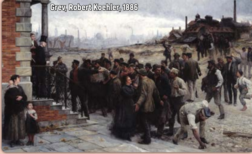
Grev, Robert Koehler, 1886

Zaman aktı kendi yolunda, kapitalizm gelişti. Fabrikalar ve şehirler kuruldu, işçi sınıfı doğdu. Zincirli kölelik son bulmuştu artık, devir ücretli kölelik devriydi! Sömürüye ve zulme karşı yeni bir silah keşfetti işçi sınıfı; GREV! Bilinen ilk grev tablosu da budur. Tablo ilk olarak 8 saatlik işgünü hakkı için verilen mücadelenin doruğa çıktığı 1886 yılında, ABD'de sergilenmiştir. Dönemin sözde sanatsız tuzu kuruları burun kıvrırken bu tabloya, grev silahını kuşanan ABD'li işçiler sahip çıkmışlardır. "Grev" tablosunun çok sayıda kopyası işçiler arasında elden ele dolaşacak ve böylece bu tablo hem bir mücadele aracı, hem de dönemin emek hareketinin sembolü haline gelecekti.