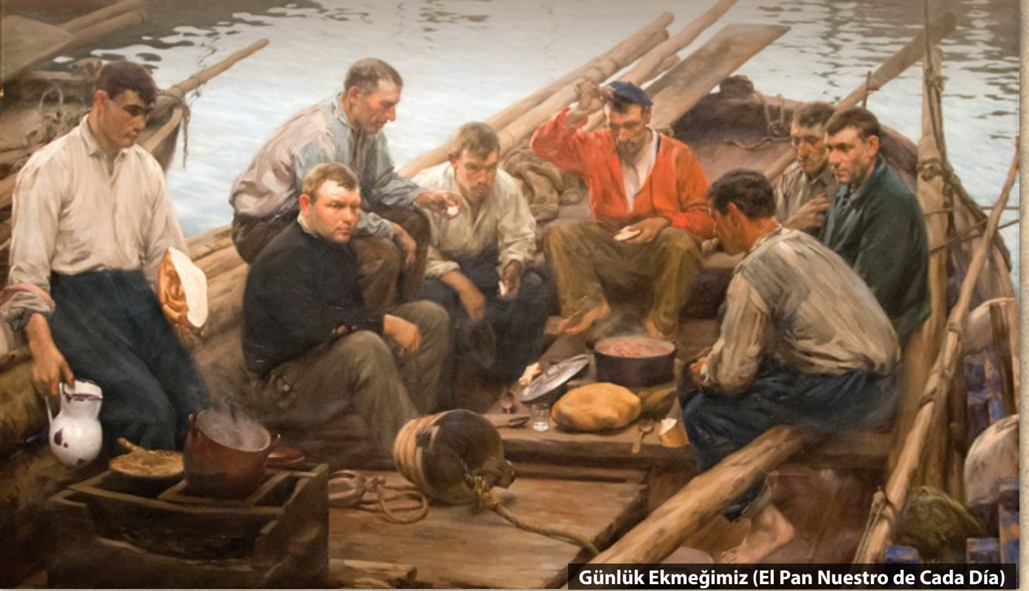
Günlük Ekmeğimiz (El Pan Nuestro de Cada Día)

Yine Ventura Álvarez Sala'nın fırçasından bir resim. 1915 tarihli Günlük Ekmeğimiz (El Pan Nuestro de Cada Día) isimli bu tabloda yemek molası veren bir grup balıkçı, bir somun ve bir kap yemeğin etrafında toplanmış. Dinlenmeye, düşünmeye ya da yaşamın anlamını sorgulamaya yetecek vakit yok. Yemeği hızlıca bitirip işe koyulmalılar. Yaşamak günlük ekmeğimizi çıkarmak demektir, ötesi yoktu. Ancak kenarda ayakta dikilen işçi düşünmeye başlamıştı: Yaşamak neydi? Daha iyi bir yaşam mümkün değil miydi? Hemen onun yanındaki işçi ileriye bakıyor. Aklından ne geçiyordu acaba? Belki de insanın insanı sömürmediği, yük hayvanı gibi çalışmanın son bulduğu mutlu bir yaşamı hayal ediyordu. Kim bilir?