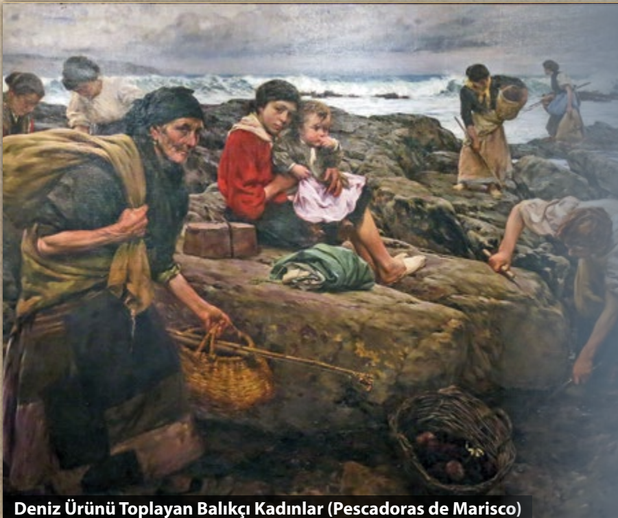
Deniz Ürünü Toplayan Balıkçı Kadınlar (Pescadoras de Marisco)

Deniz Ürünü Toplayan Balıkçı Kadınlar (Pescadoras de Marisco). 1912'de İspanyol ressam Ventura Álvarez Sala'nın fırçasından tüm gerçekliğiyle tuvale yansıyan bu resimdeki yüzler, yaşamın güzelliklerinin tadına varamadan göçüp gidenlerden yalnızca birkaçı. Resme keder hâkim, hem denizdeki dalgalar hem de yüzlerdeki acı bu kederi yansıtıyor. Masmavi sular, kayalara vuran dalgalar, o dalgaların sesi onların iç dünyasında huzur ve mutluluk gibi duygular uyandırmıyor. Çünkü onlar tüm zamanlarını aç kalmamak için iki büklüm eğilerek, deniz ürünlerini toplayarak, ıslanıp üşüyerek harcıyorlar. Sırtındaki yükte iki büklüm duran yaşlı kadının yüzündeki derin çizgiler ve kollarındaki kaslar, uzun, ağır ve yorucu çalışmanın izleri... Bir kez olsun dinlenmek, güneşlenmek ve suların müziğini dinlemek için bu denizin kıyısına gelmiş miydi acaba? Kayalıklar üzerinde annesine merakla bakan, gözlerinin arkasına hüznü yerleşmiş bu çocuğu nasıl bir gelecek bekliyordu? Gelecek günlerde İspanya'da işçi sınıfının daha iyi yaşam koşulları için mücadeleyi büyüttüğünü biliyoruz.