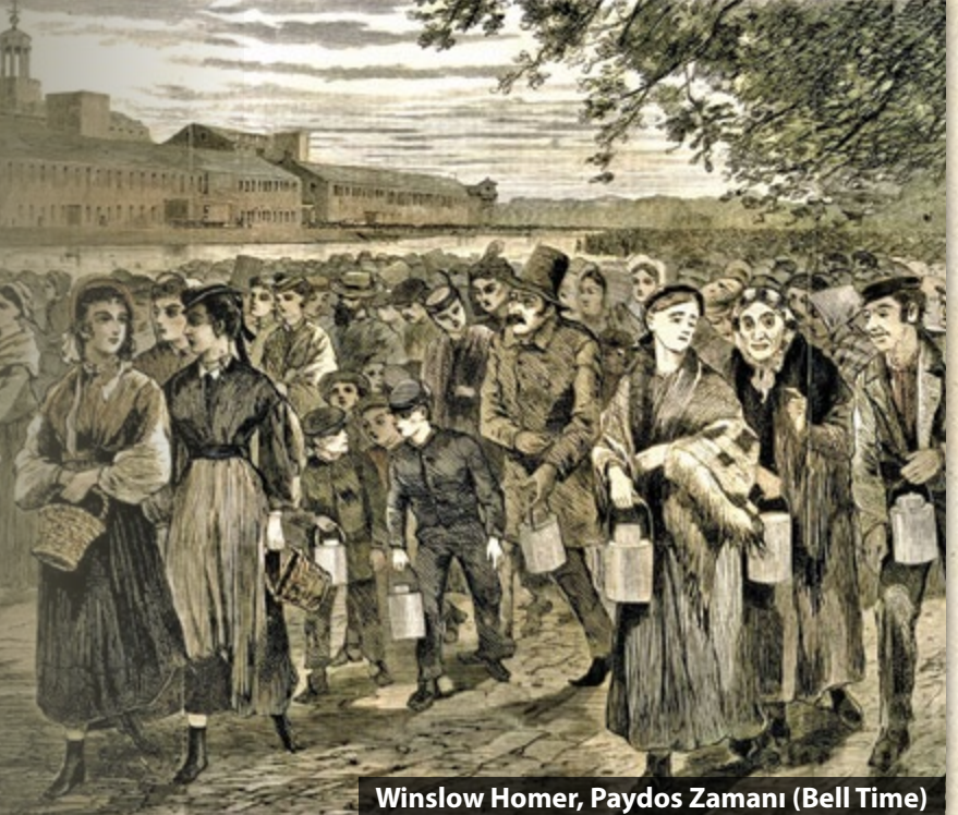
Winslow Homer, Paydos Zamanı (Bell Time)

Teknoloji patronlar sınıfının denetiminde olduğu için, üreten ve alın teri döken işçiler uzun saatler boyunca yük hayvanı gibi çalışmaya devam etti, ediyor. 1868 Amerika'sının fabrika işçilerini tasvir ediyor bu resim. Onların yaşadığı zaman yeni ve gelişmiş makinelerin icat edildiği, sanayinin geliştiği, üretimin hızlandığı döneme, yani fabrikalarda sayıları giderek artan işçi ordularının gece-gündüz demeden çalıştığı döneme denk gelir. Winslow Homer, Paydos Zamanı (Bell Time) isimli tablosuyla şehrin her yanından görülebilecek görkemli kulesiyle dikilen bir fabrikayı ve paydos zili ile işçilerin eve dönüşünü resmeder. Zamanın kasvetli havası yalnızca yorgun kadın ve erkek işçilerin yüzünde değil, sefer taslarını tutan çocuk işçilerin uzun çalışma saatlerinden bitap düşmüş bedenlerinde de gezinir. Yeni makineler ve teknolojik ilerlemeyle çok daha kısa sürede çok daha fazla ürün elde etmek, çalışma sürelerini kısaltmak mümkündü. Ama sömürücü efendilerin düzeninde kölece çalışma koşullarına mahkûm edilen işçi sınıfı için, uzun saatler boyunca çalışmaya rağmen açlık ve yoksulluk vardı.