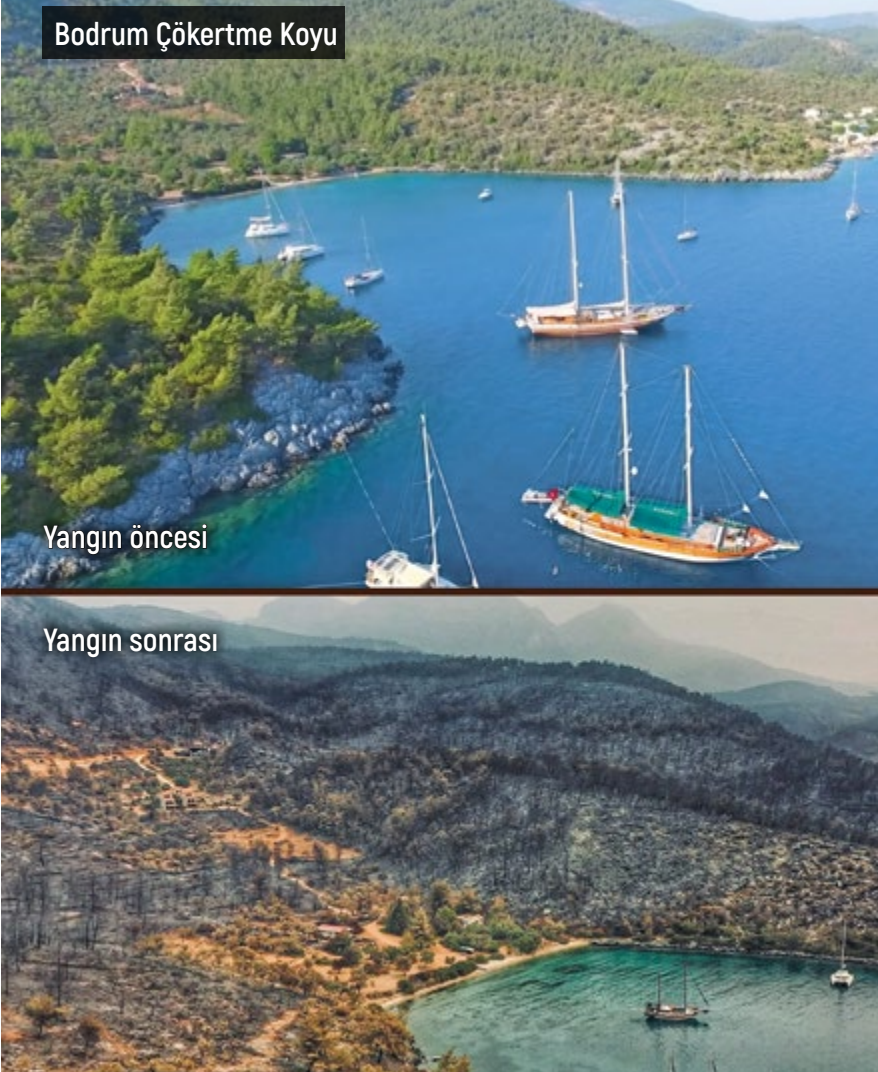
Bodrum Çökertme Koyu