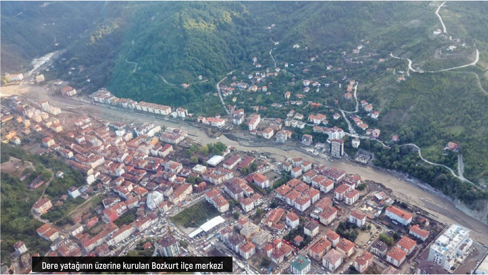
Dere yatağının üzerine kurulan Bozkurt ilçe merkezi

lik taşkın alanına sahip Ezine deresinin yatağı zamanla daraltılmış ve sonunda 15 metrelik düz bir kanalın içine hapsedilmiş. Bozkurt'ta göz göre göre dere yatağı imara açılarak çok katlı binalar yapılmasına izin verilmiş. Dere yatağında yerleşimin önünü açan ise o zamanlar adı Çevre, Orman ve Şehircilik Bakanlığı olan bakanlık. Sel sularıyla yıkılan binalar sadece birkaç yıllık. Orman Genel Müdürlüğü'nün dere yatağına kurduğu tomruk deposu ve taşkın riski gözetilmeden yapılan köprüler ise felaketin bir başka nedeni. Yıkılan köprülerin yeniden yapılacağını söyleyen Erdoğan, 500 yıl önce bilinen bir şeyi yeni keşfetmiş gibi; "Bunlar bizim işimiz, siz rahat olun... Artık düz köprü değil, kemer köprü..." diyor.