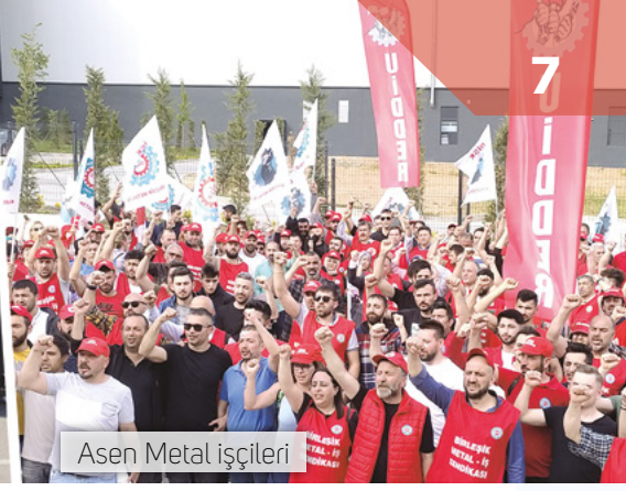
Asen Metal işçileri