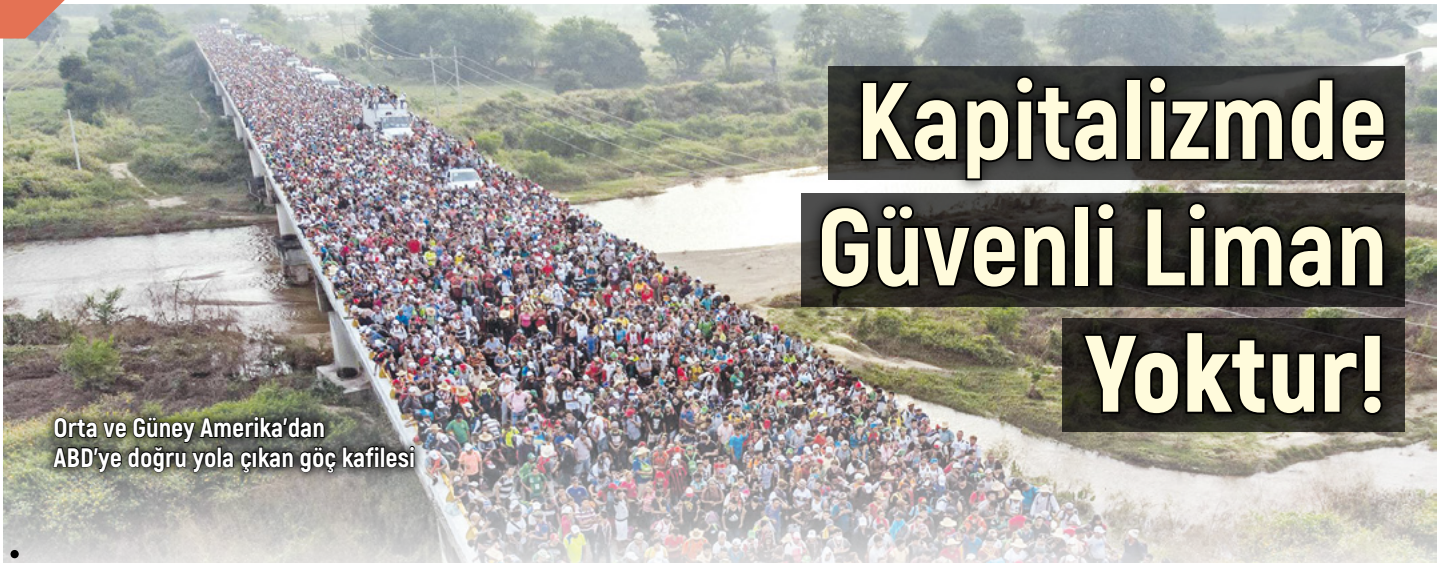
Orta ve Güney Amerika'dan ABD'ye doğru yola çıkan göç kafilesi