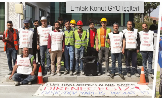
Emlak Konut GYO işçileri

Mayıs ayında önemli bir başka direniş haberi de Kocaeli/Dilovası 'ndan geldi. İMES Sanayi Sitesinde bulunan Asen Metal fabrikasında işçiler; çalışma koşullarını düzeltmek, düşük ücretlere ve baskılara dur demek için DİSK/Birleşik Metal-İş Sendikasında örgütlendiler. Asen Metal patronu işçilerin haklarını aramasına tahammül edemedi, hukuksuz bir şekilde işten atma saldırısına girişti. Bu saldırıya boyun eğmeyen işçiler, Birleşik Metal-İş Gebze 1 No'lu Şube öncülüğünde direnişlerini sürdürüyorlar, tüm emek dostlarını desteğe çağırıyorlar. ■