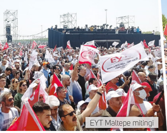
EYT Maltepe mitingi