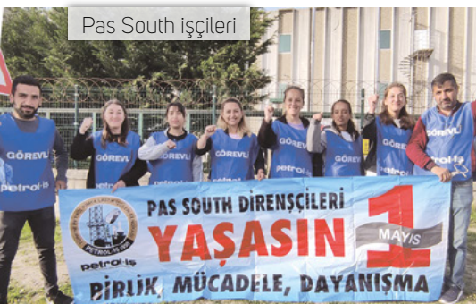
Pas South işçileri