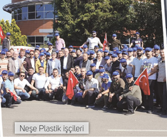
Neşe Plastik işçileri