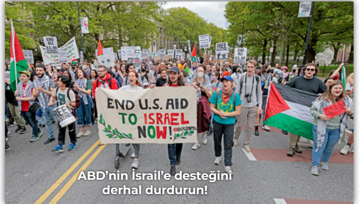
ABD'nin İsrail'e desteğini derhal durdurun!

ABD'de 7 Ekimden bu yana Filistin halkıyla dayanışma eylemleri kesintisiz sürüyor. Üniversite kampüslerinde devam eden "Gazze ile Dayanışma Kampı" eylemleriyle savaş karşıtı hareket büyümeye devam ediyor. İsrail'in Refah'taki son saldırılarının ardından öfkesi büyüyen ABD'li işçi ve öğrenciler New York'tan Kaliforniya'ya birçok eyalet ve kentte düzenledikleri