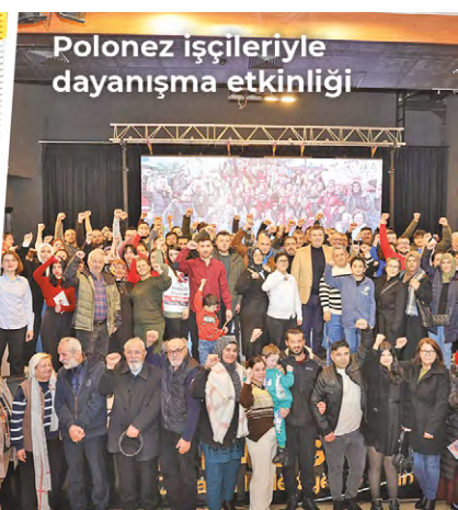
Polonez işçileriyle dayanışma etkinliği