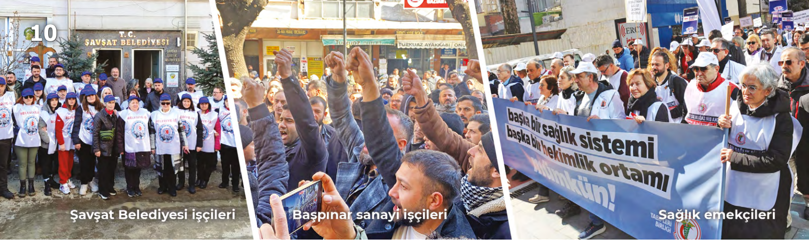
Şavşat Belediyesi işçileri